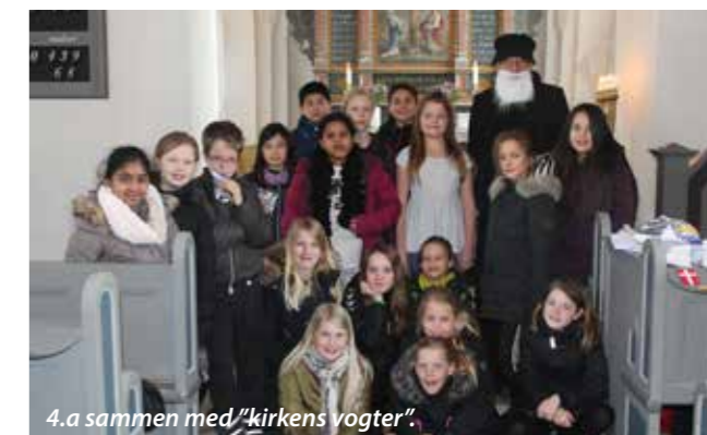
4.a sammen med "kirkens vogter".