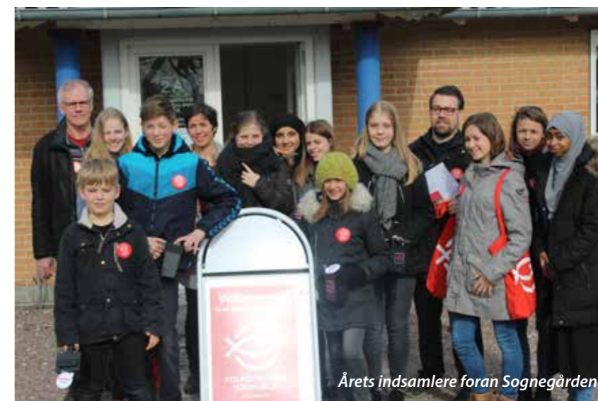
Årets indsamlere foran Sognegården