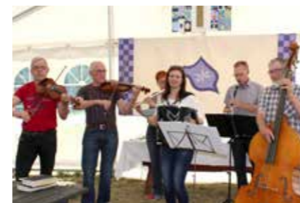
"Knap så rask" spillede under morgenkaffen og ved gudstjenesten i teltet.

Glimt fra byfesten i Spørring den 18. juni 2017