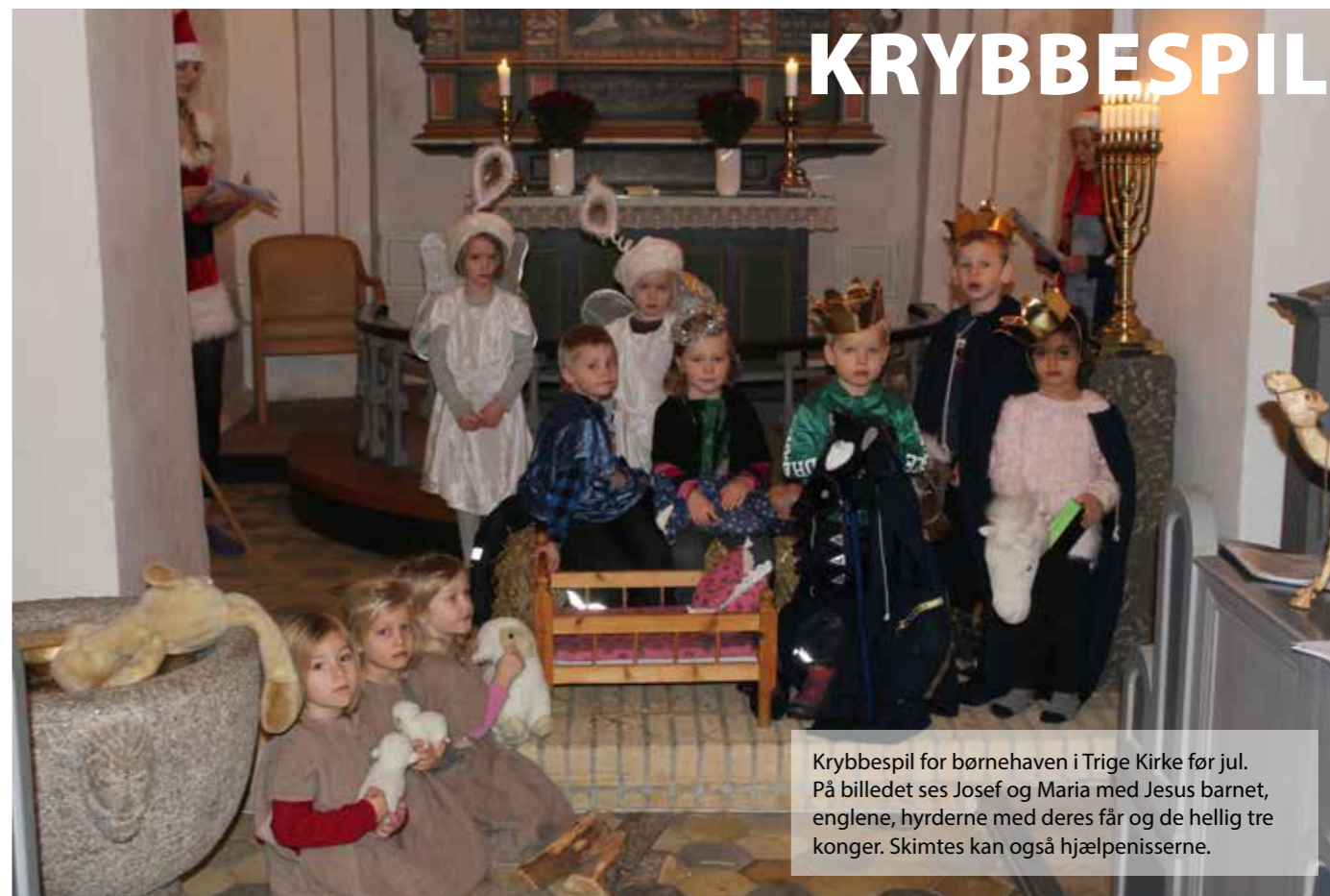
Krybbespil for børnehaven i Trige Kirke før jul. På billedet ses Josef og Maria med Jesus barnet, englene, hyrderne med deres får og de hellige tre konger. Skimtes kan også hjælpenisserne.